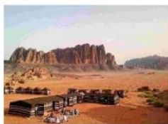
ทะเลทรายวาดีรัม