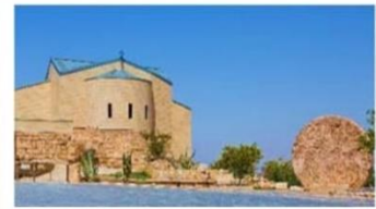
The Moses Memorial Church