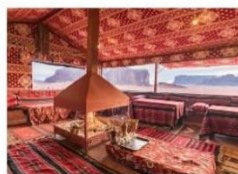
นอนแคมป์

** พักที่ Zawaydeh Camp 4* Hotel หรือเทียบเท่า **